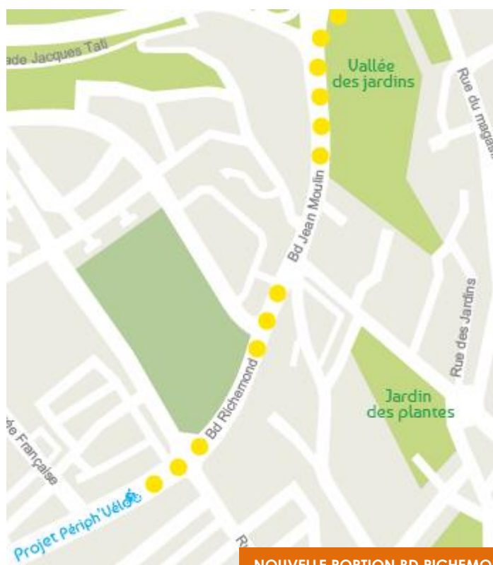
NOUVELLE PORTION BD RICHEMOND